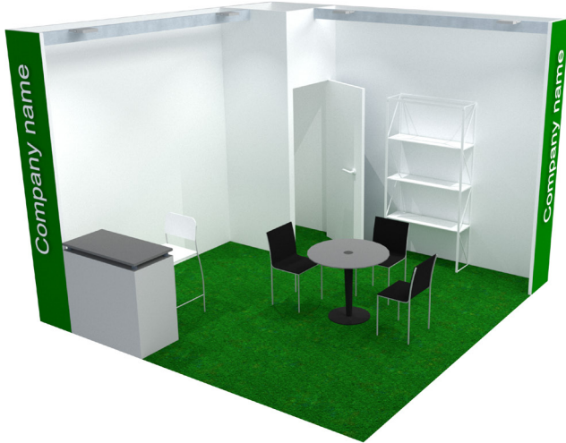
2 Lati aperti - 2 Open sides